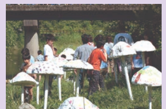
地域創造アートプログラム