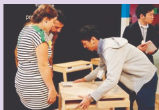
ものづくり交流プログラム