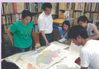
地域再生デザインプログラム