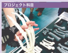
ホネ・プロジェクト