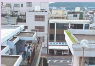
都市空間デザインプログラム