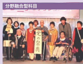
モダンシニア・ファッションショー